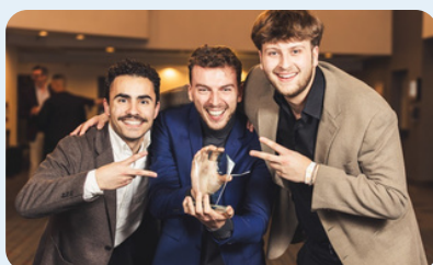
2 e place Épreuve Étude de cas, secondaire