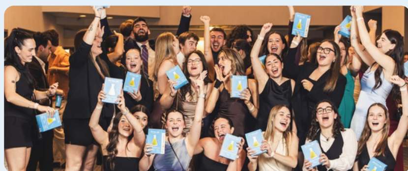
Équipe lauréate Prix Antidote