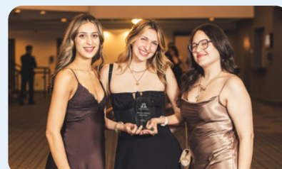
2 e place Épreuve EHDAА secondaire