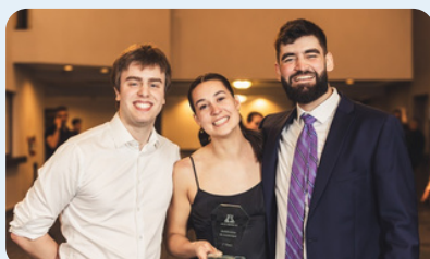
1 re place Épreuve Mobilisation du numérique