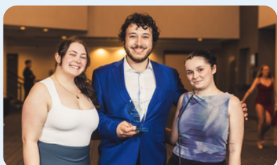
1 re place Épreuve EHDAА primaire

La délégation de la FSE s'est hissée à la 3 e place du classement général parmi les neuf universités ayant participé à la 4 e édition des Jeux de l'éducation. Les étudiantes et étudiants de la Faculté se sont démarqués dans plusieurs épreuves.