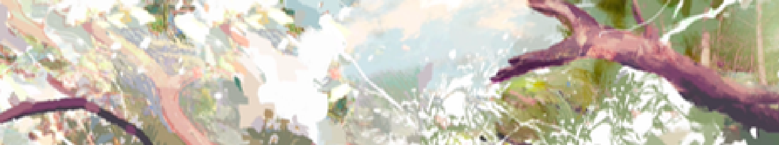
Illustration: James Lee Chiahah