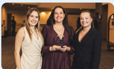
2 e place Épreuve Évaluation