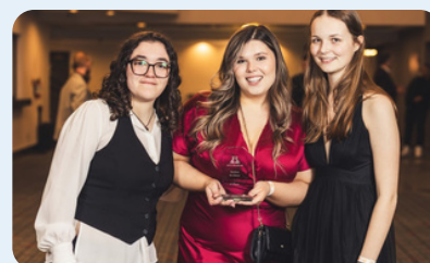
3 e place Épreuve Gestion de classe