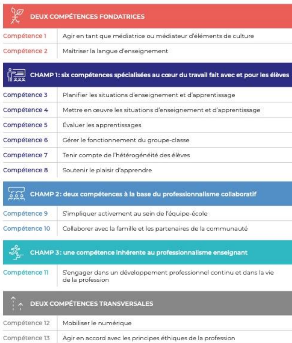
Tableau 1: Synthèse des 13 compétences professionnelles du personnel enseignant

Chaque année, les 13 compétences sont approfondies en fonction du niveau de maîtrise attendu pour chaque stage . Dans le cadre des séminaires à l'université, le référentiel des compétences est analysé en profondeur. Chaque compétence est accompagnée de dimensions auxquelles se réfèrent les co-formateurs (superviseur et enseignant associé) pour se prononcer sur le niveau d'atteinte par le stagiaire. Le tableau ci-dessous présente une synthèse de ces 13 compétences.